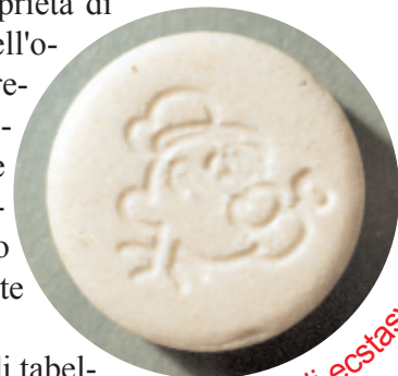
pasticca di ecstasy

I derivati delle amfetamine sono un'eterogenea classe di sostanze (vedi tabella) caratterizzate, oltre che da un effetto di stimolazione del sistema nervoso centrale, da un potere "empatogeno". I nomi con i quali queste sostanze vengono usualmente smerciate sul mercato illecito sono spesso in relazione alla forma delle pillole. La forma in cui vengono vendute non consente però di identificare correttamente il dosaggio e il contenuto di una pillola, verificabili solo in laboratorio. In alcuni casi si sono riscontrati tagli di LSD, amfetamine, morfina. Gli effetti dei tagli sono quindi molto diversi e imprevedibili.