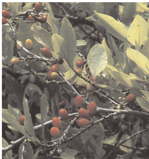
pianta di coca

La cocaina è un composto chimico derivato dalla coca, una pianta che si coltiva in America del Sud, nella zona andina tra i 500 ed i 1000 mt.