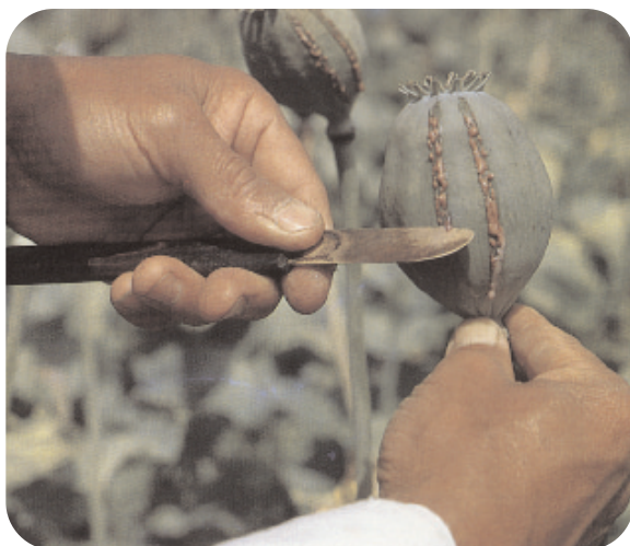
incisura della capsula del papavero

Attraverso successive raffinazioni si ottengono dalla pianta del papaver somniferum: oppio, morfina ed eroina.