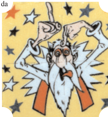
francobollo intriso di L.S.D.

RISCHI PER LA SALUTE: neurotossicità, manifestazioni di tipo schizofrenico, fenomeno del "flash-back" con ripetizione delle allucinazioni senza nuove assunzioni di droga.